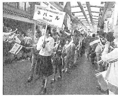
池高生もパレードに参加

近畿支部の皆様にはお変わりなくお過ごしでしょうか。日頃は池田高校に温かい応援のお気持ちを感じています。今年10月、大歩危小歩危溪谷の古野川はラフティング世界選手権の会場として大変賑わいました。本校生徒も男女6名が出場し、地元の声援を受けて大健闘しました。また、海外22カ国の選手団の歓