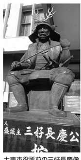
大東市役所前の三好長慶像

ブロードバンド先進県と言われる徳島。県内はインターネット環境が整備されています。三好市ホームページから、「観光ライブカメラ」で素晴らしい故郷が楽しめます。