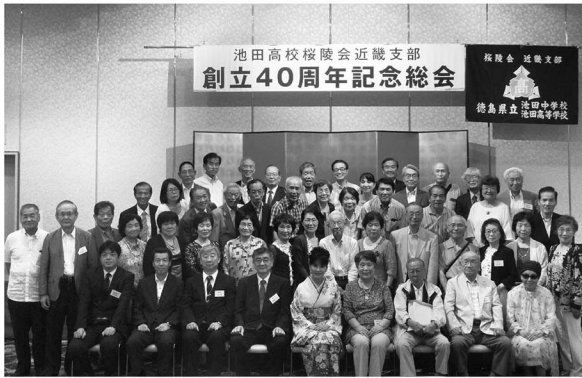
池田高校桜陵会近畿支部 創立40周年記念総会